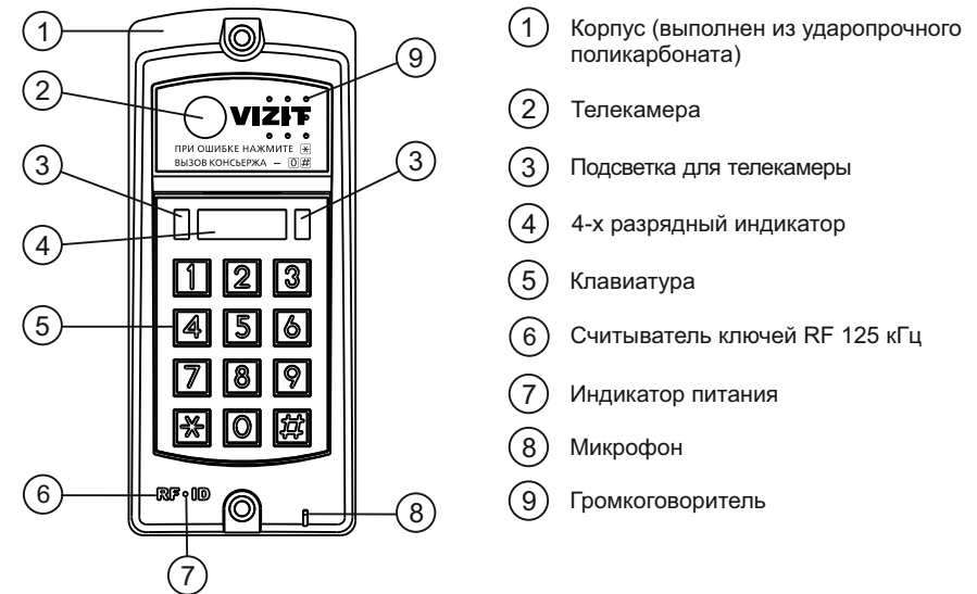
Рисунок 1 - Внешний вид блока

Блок вызова домофона БВД-317RCBW (в дальнейшем - блок вызова) используется совместно с блоками управления БУД-302М, БУД-302S, БУД-302К-20, БУД-302К-80, БУД-302S-20, БУД-302S-80, БУД-430, БУД-430М, БУД-430S, БУД-485, БУД-485М и БУД-485Р как составная часть многоквартирных домофонов и видеодомофонов VIZIT (серии 300, 400).